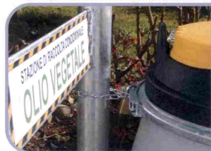
Chiusura a moschettone in acciaio zincato, predisposta per chiusura con lucchetto