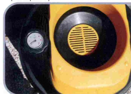
Misuratore di livello per monitorare la quantità dell'olio al suo interno