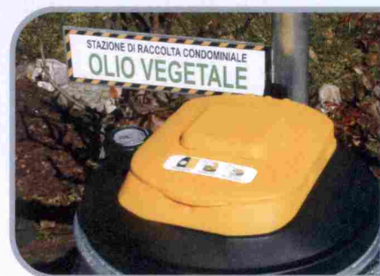
Coperchio ad apertura manuale antiribaltamento con filtro antiodore